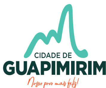
Tabela de Remuneração das Funções Gratificadas da Guarda Civil Municipal e Guarda Ambiental do Município de Guapimirim* e Defesa Civil**